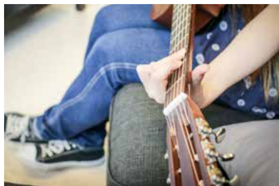
Matglede, sang og musikk er en naturlig del av hverdagen på P22.