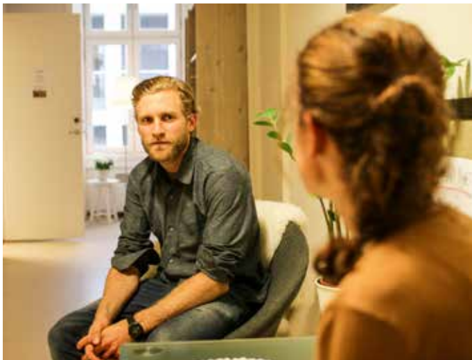
Tett medisinsk - og sosialfaglig oppfølging vektlegges.

Hos oss skal den enkelte få oppleve kjærlighet, respekt, omsorg og ansvarliggjøring.