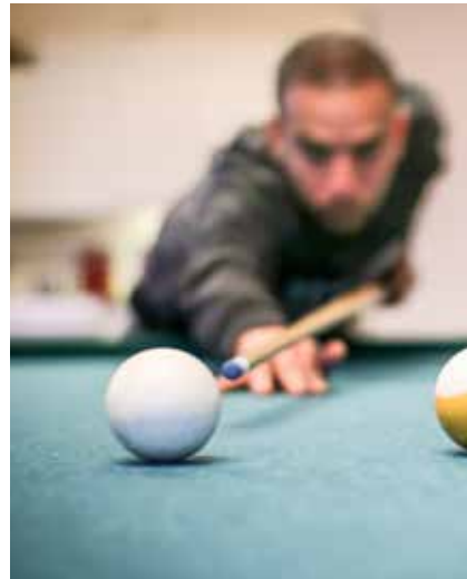
Siktet skjerpes mot en rusfri fremtid.